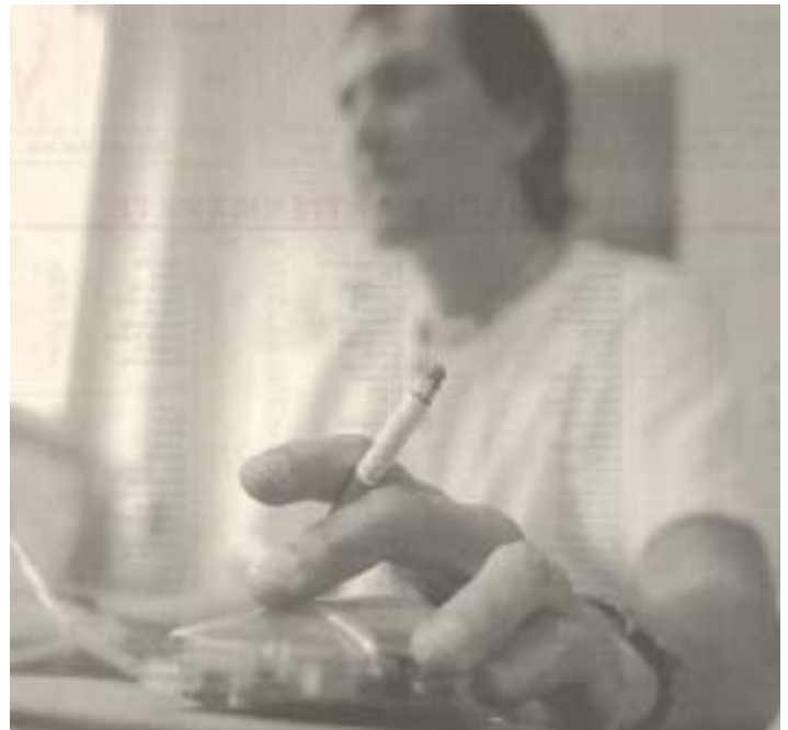
Rauchen kann der Gesundheit schaden – und auch dem Portemonnaie.

Rauchen, Übergewicht und hoher Blutdruck sind bekannte Risikofaktoren. Einige Versicherungsgesellschaften haben in den letzten Jahren für risikobewusste Versicherte, im Speziellen für Nichtraucher günstigere Tarife für Todesfall- und Erwerbsunfähigkeitsversicherungen eingeführt. Die Providentia geht noch einen Schritt weiter und lanciert neben dem Nichtrauchertarif zusätzlich einen «Top-fit-Tarif». Wenn sich das Gewicht und die Blutdruckwerte der versicherten Person innerhalb der medizinischen Normen bewegen, gewährt die Providentia zusätzlich einen Gesundheitsbonus und reduziert die Risikoprämie auf Todesfallrisikopolice nochmal um rund 15 Prozent.