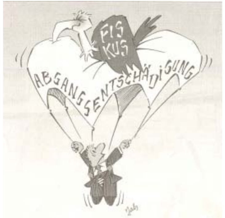
Bei den Abgangsentschädigungen packt der Fiskus zu.

Von Schmerzensgeld und Risikoprämie ist die Rede, wenn grosse Summen am Ende der Karriere fliessen. Mit Altersvorsorge haben diese Summen nicht mehr viel zu tun. Trotzdem wurden solche Zahlungen teilweise via Pensionskasse abgewickelt und somit geschickt am Fiskus vorbeitransferiert. Nun hat die Eidgenössische Steuerverwaltung reagiert und hat das Kriterium „der Vorsorge dienend“ neu definiert. Generell kann festgestellt werden, dass seit 1. Januar 2003 wohl ein Grossteil solcher Abgangsentschädigungen vollumfänglich mit dem ordentlichen Einkommen zu versteuern ist. Das wäre jedoch vor allem hart für Mitarbeiter, welche wegen der andauernden Wirtschaftsflaute gezwungen sind, früher in den Ruhestand zu treten, und deshalb auf eine Abfindung für zukünftigen