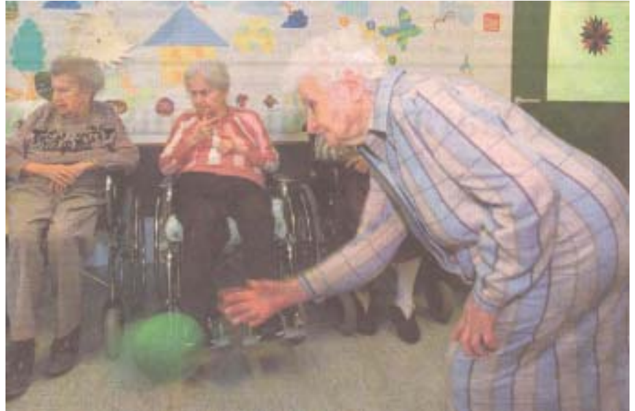
Direkte Nachkommen sind unterstützungspflichtig, wenn das Geld der Senioren nicht reicht: Bewohnerinnen eines Altersheim