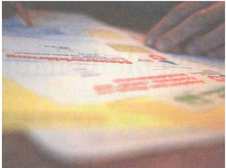
Die leidige Steuererklärung: Wer sich vorbereitet, fährt besser

Nach wie vor bestimmt der Wohnsitz über die Höhe der Steuerbelastung. Vor allem für Personen, die sehr mobil sind oder die ohnehin Ihren Wohnort wechseln wollen, lohnt sich der Umzug in eine steuergünstige Gemeinde - selbst dann, wenn der Weg zur Arbeit dadurch länger wird. Die Kosten für den Arbeitsweg können nämlich vom Einkommen abgezogen werden. Der Wohnsitz am 31. Dezember ist für die Einkommens- und Vermögenssteuer massgebend. Die neue Gemeinde erhebt die Steuern für das ganze vergangene Jahr. Viele öffentliche Verwaltungen sind über die Weihnachts- und Neujahrstage geschlossen. Melden Sie sich deshalb rechtzeitig bei der