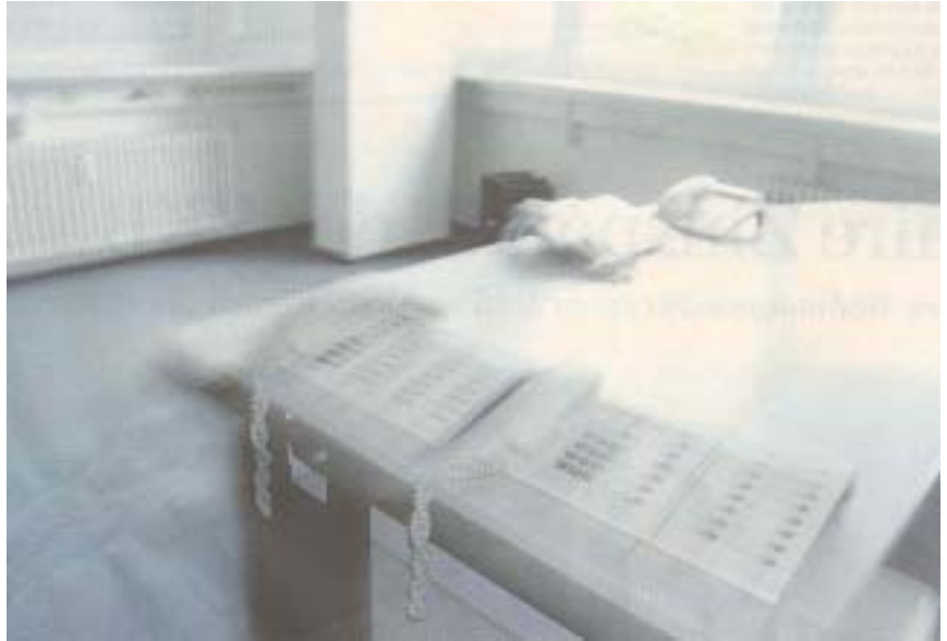
Fallen Arbeitnehmer wegen Invalidität aus, steigen im Betrieb die Lohnabzüge und Prämien für Arbeitnehmer und –geber

Nur eine rasche Rückkehr an den Arbeitsplatz verhindert Invalidität. Die Statistik zeigt, dass nach einem Jahr Krankheit nur noch 5 Prozent an den Arbeitsplatz zurückkehren. Nach zwei Jahren ist die Chance einer Eingliederung in den Arbeitsprozess praktisch gleich null.