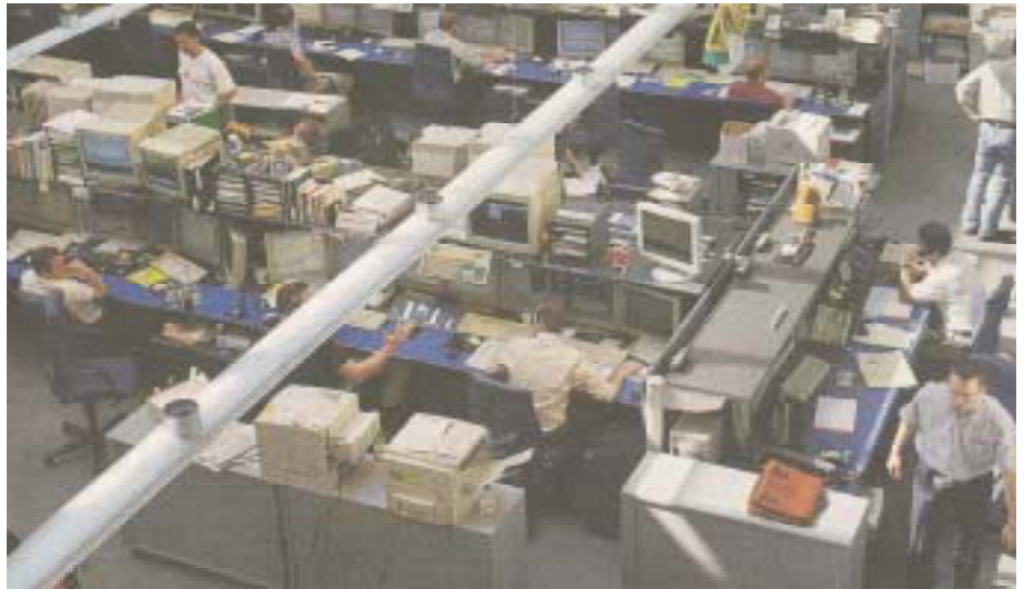
Grossbank UBS. Geht wie die Swiss Re, die SBB und die Post zum Beitragsprimat über

Trotz Beteuerungen der Arbeitgeber, dass für den Versicherten durch den Primatwechsel keine Nachteile entstehen, ist klar: Der Arbeitnehmer muss in Zukunft das Kapitalmarktrisiko selber tragen. Im Leistungsprimat ist die Altersleistung reglementarisch in Prozent des letzten Lohnes fixiert. Im Beitragsprimat hängt die